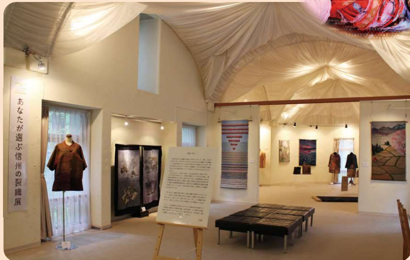
前回(第8回)の会場の様子

〒391-0115 長野県諏訪郡原村 17217-1611 TEL/FAX 0266-74-2701 https://yatsubi.com E-mail: info@yatsubi.com