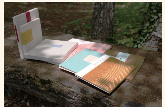
創作本、装幀本の数々

掌ほどの大きさの紙片の中に広がる、山室眞二の豊かな世界をこの機会にご覧ください。