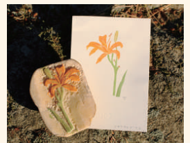
いも版と刷り上がった作品(参考)